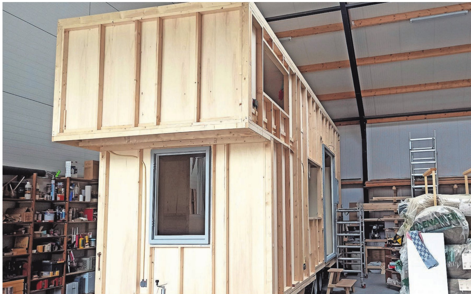
▲ Het tiny house op wielen in de werkplaats waar Erin Rietvelt en Thijs de Lange het laten bouwen.

Maar toen moest er nog wel een locatie gevonden worden. En dat bleek tegen te vallen. Gelukkig kwam Te Veld net op tijd. Eindhoven is wat dat betreft uniek, zegt ze. „Hier kunnen we onze droom verwezenlijken.” En dus zeggen